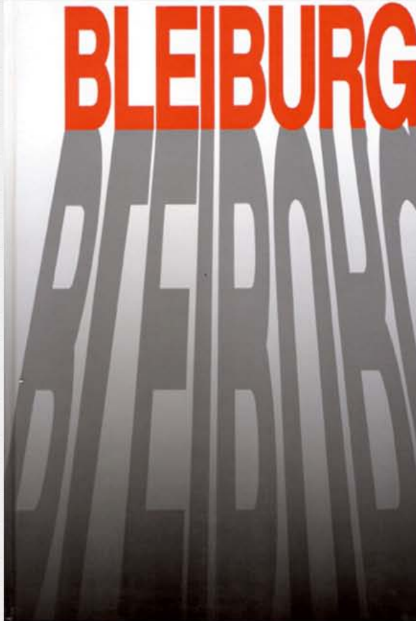
Naslovnica knjige o Bleiburgu i Križnom put koju je izda Savez antifašističkih boraca i antifašista RH

Dokazi protiv 11. dalmatinske brigade za pokolje zarobljenih ustaša i domobrana u Sloveniji