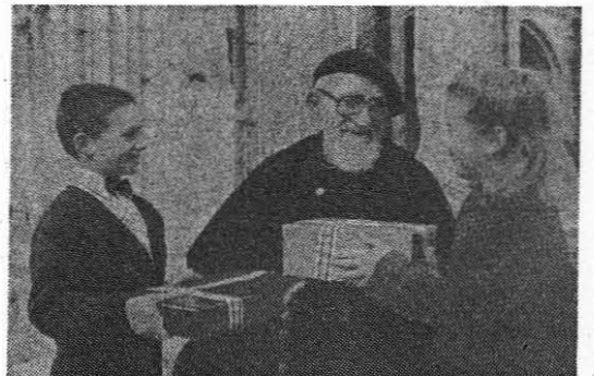
Abbé Pierre prima darove za siromašnu djecu