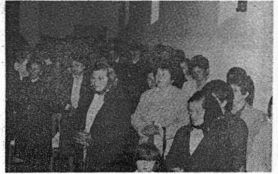
Vjernici u župnoj crkvi

Koliko je duboko vjera ukorijenjena u te kršne, čvrsta značaja, ponosne ljude iz-