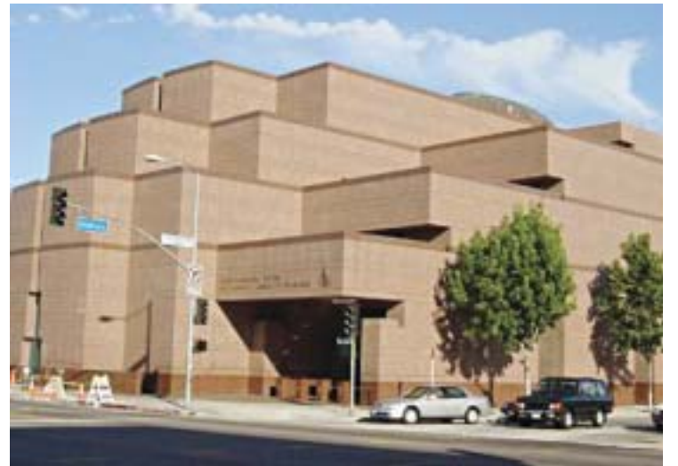
● Schmidlinov dokument dovodi pod upitnik i dugogodišnju krivotvorinu Centra Simon Wiesenthal u Jeruzalemu i njegova izvršnog direktora Ephraima Zuroffa o broju žrtava u jasenovačkom logoru

za likvidaciju zatočenika. Tome u prilog idu i na više mjesta ponovljene Schmidlinove ocjene da »logorske činjenice sve u svemu nisu loše«, da su »red i čistoća, koliko je to bilo moguće, vladali svuda«, da »vlada pri-