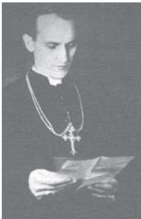
● Zagrebački se nadbiskup Alojzije Stepinac u službenim dokumentima Međunarodnoga odbora Crvenoga križa pri NDH spominje nekoliko puta u kontekstu pomoći i intervencija za zatočnike u logorima

Na taj način ne bi više postojala nikakva organizacija koja bi se na