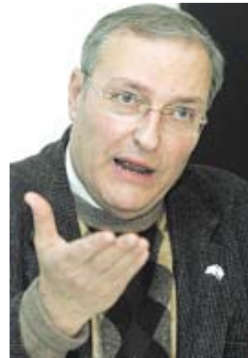
● Schmidlinov dokument dovodi pod upitnik i dugogodišnju krivotvorinu Centra Simon Wiesenthal u Jeruzalemu i njegova izvršnog direktora Ephraima Zuroffa o broju žrtava u jasenovačkom logoru

Teško je ustvrditi temeljem dvaju citiranih Schmidlinovih dokumenata kakvo je općenito bilo stvarno stanje u ustaškim logorima Jasenovac i Stara Gradiška te u ekonomiji Gredani Salaš, no ti se opisi svakako ne smiju a priori zanemariti ili odbaciti