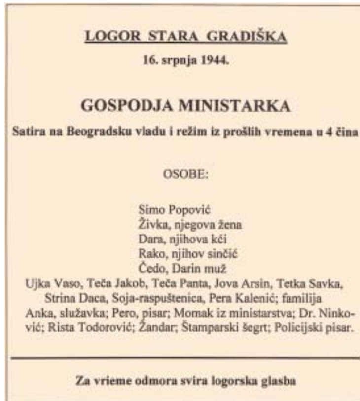
● Izvorni tekst kazališne najave koja se čuva u Arhivu Međunarodnoga odbora Crvenog križa u Ženevi pod br. ACICR, G 59/12/151 - 360.01 (2. 8. 1944)

51. Također, postoji jedno gospodarstvo (ekonomija). Vide se staje s