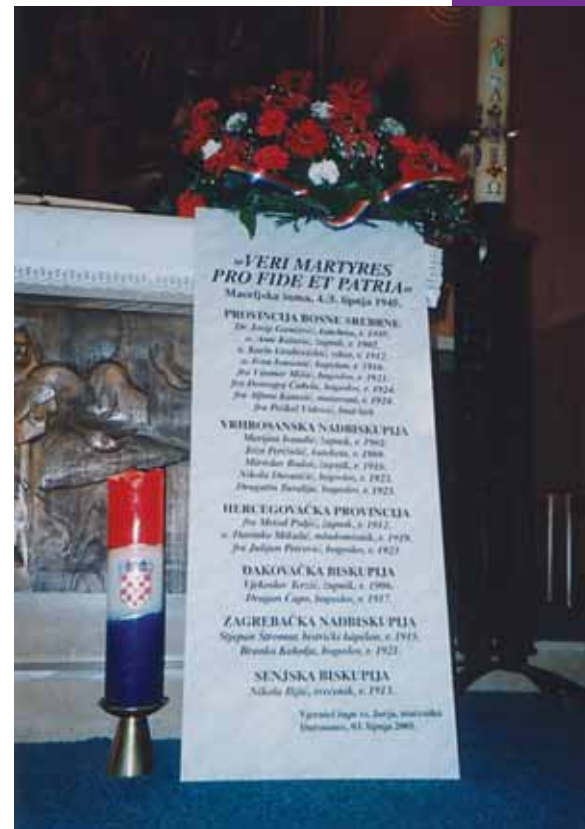
Popis ubijenih u crkvi Muke Isusove u Maclju