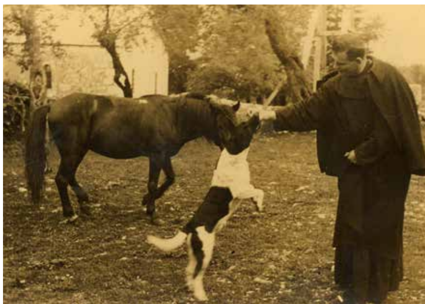
Kao župnik u Veljacima