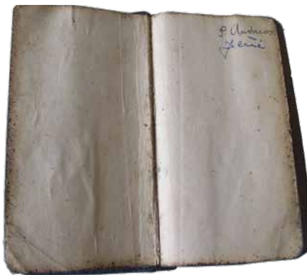
Časoslov širokobriješkog gvardijana fra Andrije Jelčića

U Knjižnici su pronađeni mnogi pisani tragovi o ubijenim fratrima. Tako su pronađene različite knjige o