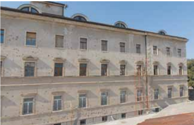
Oštećenja na Franjevačkoj knjižnici iz Domovinskog rata i početak obnove

Franjevačka knjižnica Mostar stara je kao i sam samostan sv. Petra i Pavla, a njemu je na sv. Josipa 19. ožujka 1890. temeljni kamen položio te blagoslovio početak radova biskup fra Paškal Buconjić. Knjižnica svoj uzrast i posebnu brigu zajednice bilježi osnutkom Franjevačke bogoslovije u mostarskom samostanu u jesenskom semestru 1895. Iz godine u godinu bogoslovija je rasla, bogatila se, a Provincija je uvijek u tabulama određivala pojedinog fratra koji će se brinuti o njezinu uređivanju i vođenju. Knjižnica je preživjela tri rata: Prvi i Drugi svjetski te Domovinski rat. Svaki joj je prijetio uništenjem, a na osobit način Domovinski. No, zahvaljujući upravo samostanu i svojoj Provinciji, imala je u požrtvovnim fratrima svoje čuvare i spasitelje, posebno u vrijeme Drugog svjetskog rata kad su crkva i samostan bombardirani te u Domovinskom ratu kad je 9. svibnja 1992. pred sam rat posve obnovljena crkva sv. Petra i Pavla (1866.) spaljena i srušena sa zemljom. Od buktinje