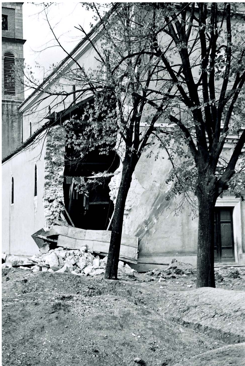
Bombardirana franjevačka crkva u Mostaru, 1945.

Ne znam koliko je dana prošlo i opet su došli i opkolili samostan. Bila je nedjelja. Narod je išao u crkvu. Vojnik je pretresao prosto- rije samostana. Nije ništa našao. Kad je došao na šišu, namjerio se je na sitni luk, što su nam donijeli ljudi iz Rodoča i Jasenice. »To ste vi sigurno odnijeli od Srba u Ba-