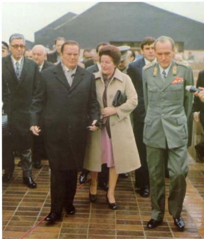
Milka Planinc, Josip Broz i Kosta Nađ

Za Deletisa je također utvrđeno da je u zapovjednom lancu bio važna poveznica između majora Dubajića i poručnice Planinc