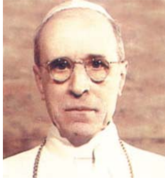
● Jugoslavenska su glasila destljećima prikazivali ulogu pape Pija XII. u Drugom svjetskom ratu isključivo u negativnom kontekstu

hutha, u kojoj se optužuje papa Pijo XII. da je svojom šutnjom - ne osudivši javno Hitlera za njegove zločine protiv Židova - bio sukri-vac uništenja milijuna židovskih života. Sigurno je o tome pitanju najbolje čuti glasove samih Židova. I o takvim glavovima već smo prije pisali. Sada vrijedi istaknuti jedno novo djelo, knjigu istaknutog Židova P.E. Lapidea: 'Tri posljednja pape i židovstvo'. Knjiga je nedavno izišla u nakladi poznate njemačke katoličke kuće Herder. Pisac, podrijetlom Kanađanin, bio je u Drugom svjetskom ratu engleski oficir, a sada je zamjenik glavnog urednika u Uredu za tisak pri izraelskom Predsjedništvu vlade... Lapideova knjiga je prije svega zbirka dokumenata. Somenut ćemo ih nekoliko. 'Kad smo mi 1944. ušli u Rim', pisao je jedan židovski oficir u telavivskom listu 'Davar', rekli su nam preživjeli rimski Židovi, puni zahvalnosti i poštovanja, da žele početi s nama u Vatikanu i zahvaliti papi. U samom Vatikanu, po samostanima i privatnim kućama, sakrivali su Židove po papinoj zapovijedi... Na samu sinagogu na Tiberu Pio XII. dao je staviti svoj pa-