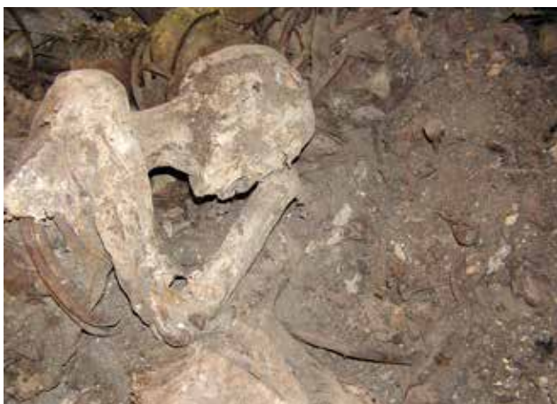
Prizor iz rova sv. Barbara u Hudoj jami