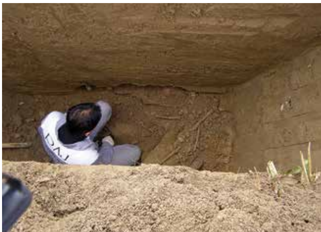
Mostec kod Brežica, sondiranje 2010.

Broj crkvenih hijerarhijskih mučenika u Sloveniji stradalih u doba komunizma iznosi više od 220, u Hrvata ih je stradalo oko 580. Istodobno, u Poljskoj je u vrijeme komunizma stradalo 187 svećenika, u Albaniji 67, u Češkoj 20, Slovačkoj 14, Mađarskoj 10. Zanimljivo je da pravni sljedbenici KPJ u Sloveniji i Hrvatskoj tvrde da je u nekadašnjoj Jugoslaviji na vlasti bio nekakav »socijalizam s ljudskim licem«. Međutim, brojke to jednostavno demantiraju. Na koji način to tumačite?