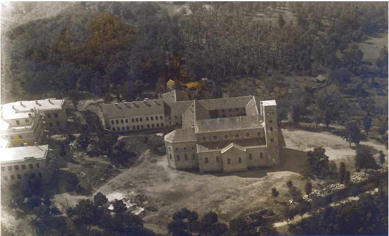
Pogled iz zraka na Široki Brijeg, 1934.

Tadija Kožul većim dijelom podigao, produžen je za 27 metara do stolarske radionice i završen. Tako je odijeljena sjemenišna ograda od samostanske. Fra Melhior Prlić postavio je nove električne stupove od centrale na južni dio gimnazije – sjemenište – samostan. Rupe za stupove iskopali su u ljeto 1941. dobrovoljno klerici.«