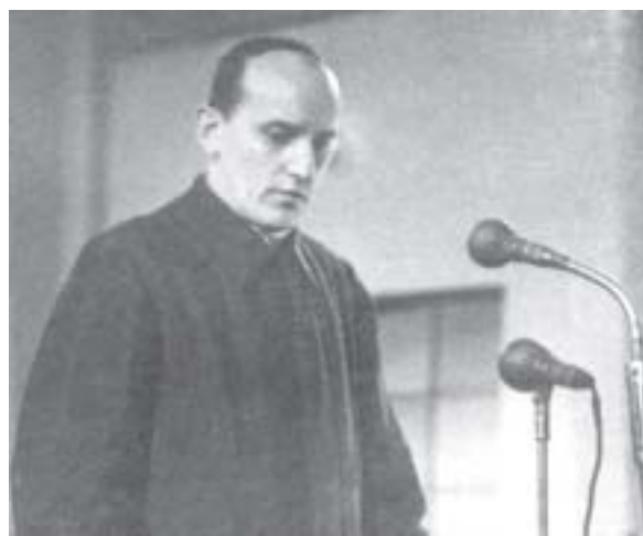
● Nadbiskup je od samoga početka bio svjestan ishoda montiranog mu sudskog procesa

Na svako pitanje bio je moj odgovor isti: 'Uskraćujem odgovor.' To ih je silno razbjesnilo i uznemirilo. Jedan me je od istražitelja konačno upravo molio: 'Dajte, dajte govorite pa će vam se vjerovati!' Kad to nije uspjelo, počeo se jedan drugi groziti: 'Ali ćete govoriti na sudu kad dođe narod.' Taj 'narod' su plaćeni propali ljudi koji su u pravim danima išli od jedne rasprave do druge i prema nalogu vikali na sudu: 'Živio pravedni narodni sud!' Zato sam na groznu odgovorio: