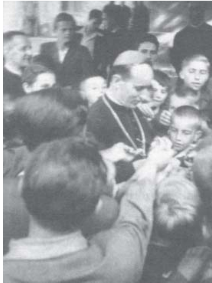
● Nadbiskup Alojzije Stepinac sa šticienicima Nadbiskupskoga konvikta g. 1942.

'Neću govoriti niti na sudu, osim što budem smatrao za dobro.' Tako sam i učinio.