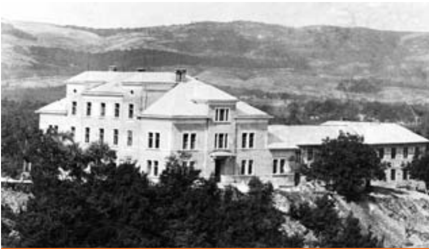
Dovršena zgrada konvikta za vanjske đake

državne i »prosvetne« izaslanike, i odreda je rad ove škole u njihovim izvješćima ocjenjivan visokim ocjenama. Profesori, nakon okončanja teološkoga studija, završavaju studij iz predmeta koji predaju na gimnaziji, a nerijetko iz toga predmeta postižu magisterije i doktorate. Da bi životni uvjeti đaka bili na što višoj razini, Provincija na rijeci Lištici – uz Fratarsku mlinicu iz 1860., a dijelom i u samoj mlinici – podiže hidroelektranu kako bi gimnazijska zgrada, konvikt, samostan te prateći objekti imali rasvjetu i vodu za piće i potrošnju. Na samostanskom imanju sijalo se žito i uzgajalo voće i povrće da bi djeca imala što bolju i odgovarajuću prehranu. Gimnazija je zaposlila izučene kuhare, pekare, kućepazitelje koji su s velikom odgovornošću radili svoj posao. U ljetnim praznicima »kržljaviji« su đaci odlazili na planinski zrak u Polja 15 gdje su brigu o njima preuzimali članovi profesorskog zbora. U tu svrhu 1932. u Masnoj je Luci sagrađena fratarska kuća za odmor i za sjedište samostalne kapelanije Polja. Stega je bila na zavidnoj razini. Uz obvezno gimnazijsko škol-