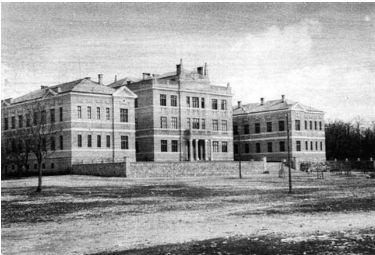
Netom dovršena gimnazijska zgrada

zahvaljujući samoprijegoru fratara u župama po Hercegovini te milodari-ma koje su fratri isprosili od crkvenih i svjetovnih ustanova. Teško je išlo s kreditom iz državne subvencije, teško s pomoću koju je Provincija tražila preko papinskoga nuncija. Sve je to usporilo zamišljenu izgradnju te je u nedovršenoj gimnazijskoj zgradi održana prva školska godina 1927./28., a zgrada je bila posve završena tek školske 1931./32. godine. Nacrt su učinili inženjeri Miloš Komadina i Pop Alamour iz Mostara tijekom 1924. Zgrada u tlocrtu ima oblik tiskanog velikog slova »E« Po cijeloj svojoj dužini i vanjskim krakovima toga slova uz visoko prizemlje ima i kat s potkrovljem, a središnji se dio toga slova od visokog prizemlja diže na dva kata. Njezino je pročelje bogato ukrašeno štukaturom, otvori su veliki, učionice su prostrane i prozirne. Pod sjevernim je dijelom podrum, koji su graditelji bili namijenili za gimnazijski muzej. Iznad