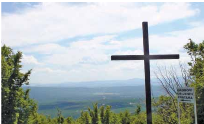
Puk u Mostarskom Gracu i dalje čuva mjesta gdje su bili pokopani pobijeni franjevci

Pred komunističkom vojskom puk bježi iz Mostarskog Graca. Zavojevači nemilosrdno strijelaju uhićene.