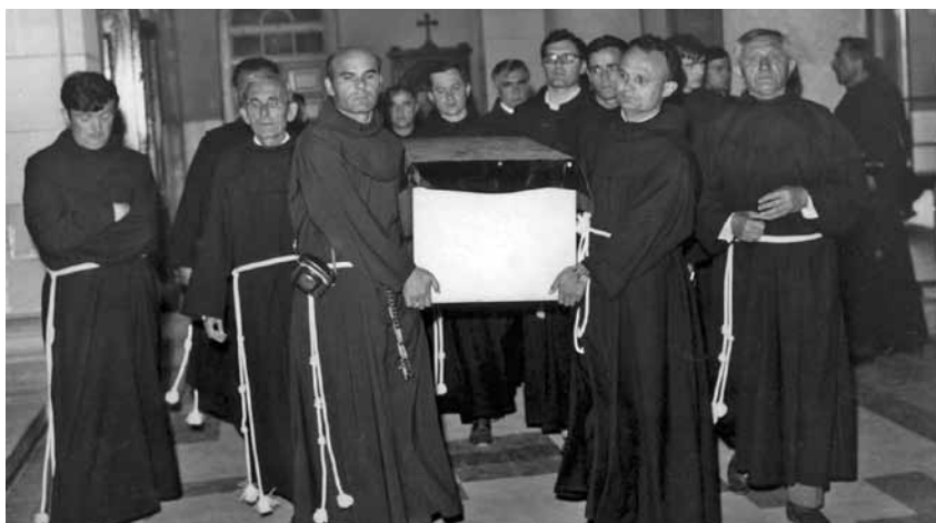
Prijenos posmrtnih ostataka franjevac pobijenih u ratnom skloništu. Široki Brijeg, 1. srpnja 1971.

Komunističko topništvo nije uspjelo razoriti širokobriješku samostansku crkvu. Ni ona ni samostan nisu bili neka vojna utvrda.