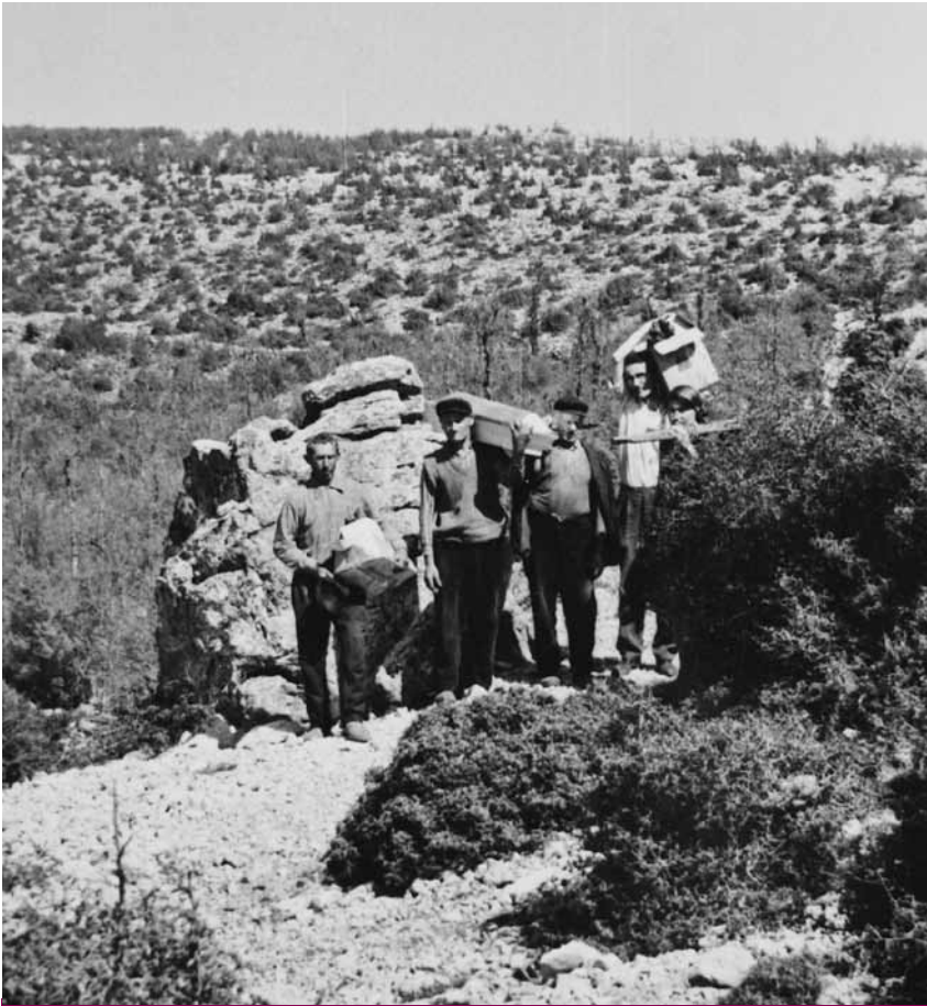
Iskopavanje posmrtnih ostataka pobijenih u Mostarskom Gracu 1971.

prije suđeni, kad im je dokazana krivica onda su pobijeni.