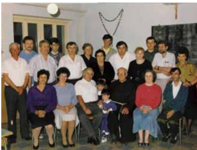
Njihove su ruke pakirale Naša ognjišta

djelatnosti, da su povezani s ekstremnim ustaškim organizacijama, da uređivanjem Naših ognjišta iskazuju neprijateljske pobuda te da zlonamjerno i negativno istupaju radi podrivanja poretka SFRJ. 30