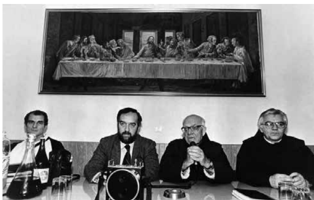
Sudionik je Bijelog puta, probijanja blokade Lašvanske doline

Ratni ministar obrane Republike Hrvatske, »olujni ministar« Gojko Šušak isticao je da je imao sreću pripadati gimnazijskom naraštaju na Širokom Brijegu kojemu je fra Ferdo bio vjeroučitelj. Govorio je da ima samo još jednu stvar reći, a to je: »Zahvaliti Bogu što pripadam naraštaju koji je dočekao slobodnu Hrvatsku i naraštaju kojemu je fra Ferdo bio putokaz. Ovdje danas zazivam Svevišnjega da meni i narodu ove ispaćene Hercegovine dadne snage da slijedimo ono što je fra Ferdo tako vjerdostojno i slijedio i propovijedao: vjeru u Boga, vjeru u Domovinu, vjeru u obitelj, vjeru u čovjeka.« 37