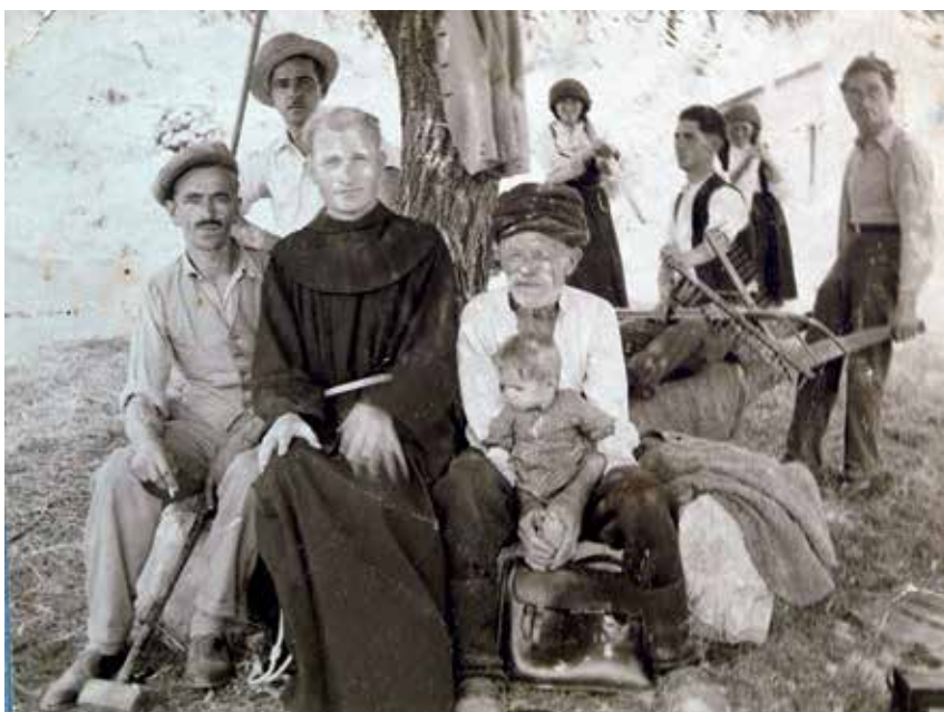
Na jednom od dušobrižničkih pohoda