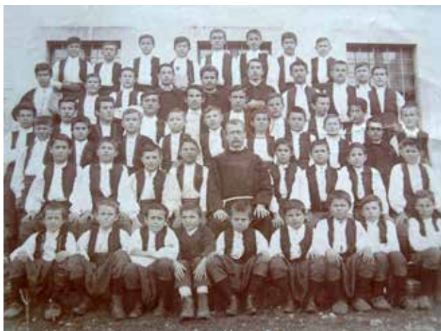
Kao đak školske god. 1912./13. (označen krugom)