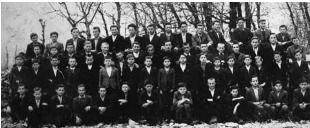
Jedan od posljednjih naraštaja franjevačkih sjemeništaraca na Širokom Brijegu