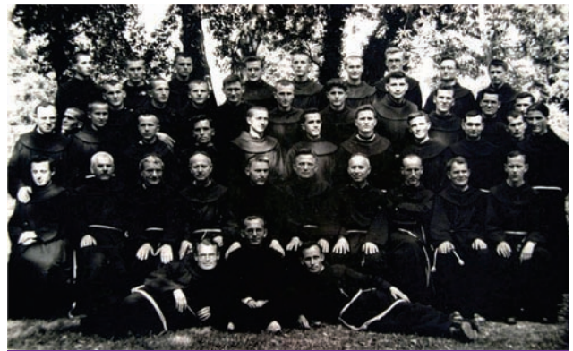
S profesorima, bogoslovima i novacima u Veljacima 16. svibnja 1944., sjedi krajnje zdesna. Mnogi od njih nisu doživjeli sljedeći svibanj, komunisti su ih pobili.