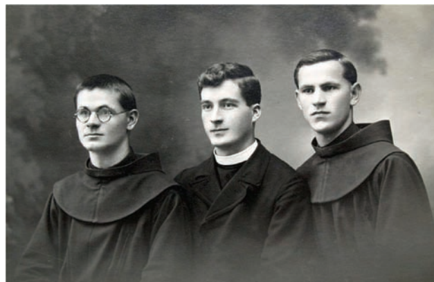
Kao bogoslov u Parizu 1931., krajnji desno