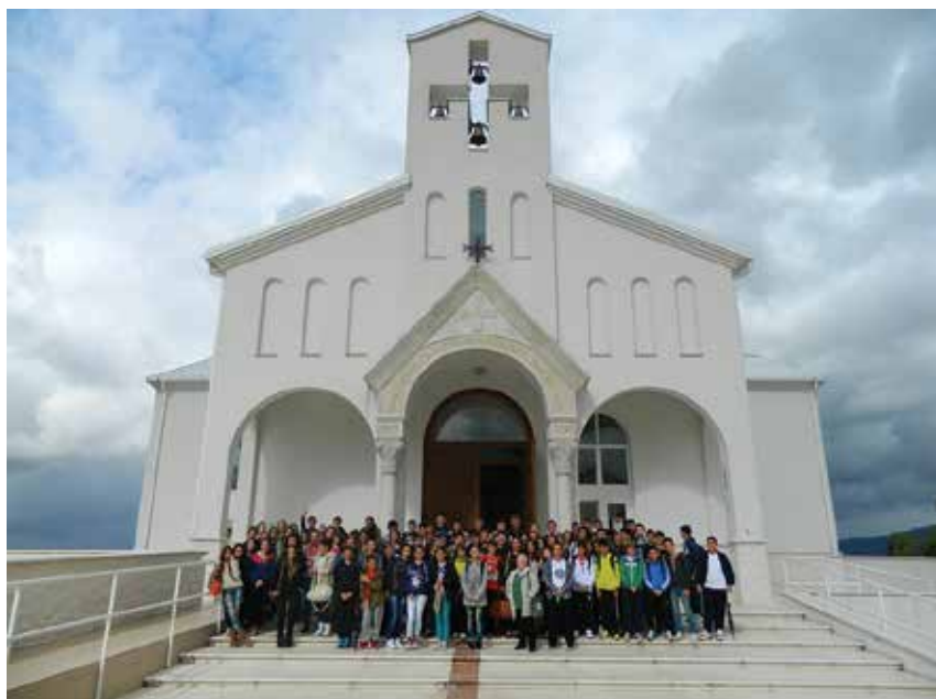
Mladež ispred Crkve hrvatskih mučenika na Udbini za čiju je izgradnju najzaslužniji biskup Mile Bogović

Kao voditelj ove Komisije, na koje poteškoće najčešće nailazite?