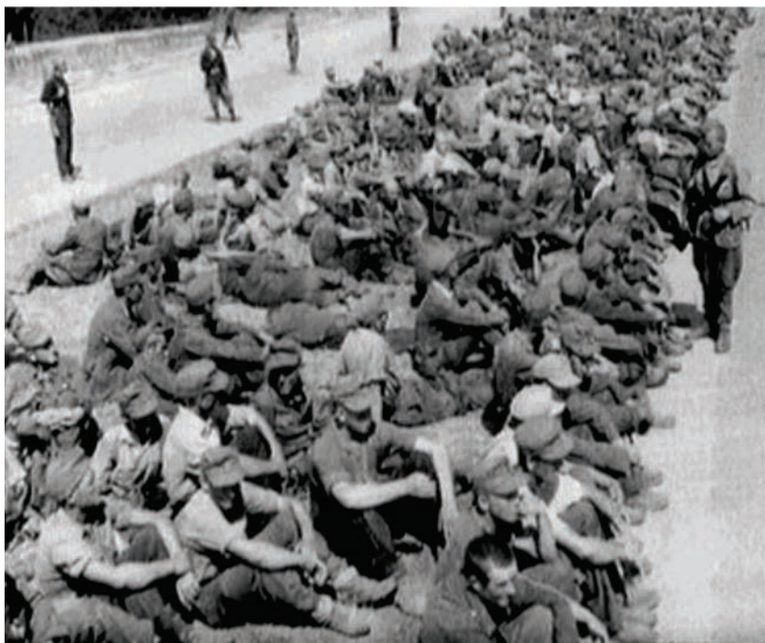
Uhićeni hrvatski vojnici i civili s komunističkim pratiteljima na Križnom putu

Ja sam pošao iz Zagreba 7. svibnja 1945. u 10 sati sa bolničkim vlakom Ustaške Obrane kao svećenik te postrojbe. Zapovjednik vlaka je bio dr. Šime Cvitanović, pukovnik-liječnik. U vlaku je bilo oko 500 bolesnih zatim 200 oboružanih vojnika sa nekoliko časnika te oko 700 žena, djece i građanskih osoba, koji su u zadnji čas pristupili vlaku da izbjegnu iz Zagreba a među njima 40-50 svećenika. Vlak je bio dobro snabdjeven hranom i bolničkim materijalom. Od Zagreba do Maribora putovali smo dva i pol dana s razloga jer su nas znali slovenski željezničari na svakoj stanici preko potrebe dugo zadržavati u očitoj namjeri a vjerojatno i instruirani da nas što dulje zadrže, jer su znali da od Graca nastupaju prema Mariboru Rusi i Bugari. Tako se je i desilo.