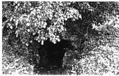
● Stratište na kojem su ubijeni širokobriješki franjevci