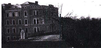
Zgrada današnje akademije Ilkovich umjetnosti

1. Fotografija s nekog narodnog veselja u Hercegovini - točna lokacija nije poznata