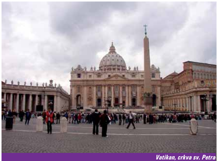
Vatikan, crkva sv. Petra

Svjedoci. Najprije su nam potrebni svjedoci o zadnjim trenutcima pobijene braće, kao i svjedoci o mržnji prema vjeri njihovih ubojica ili nalogodavatelja. Potrebni su nam i svjedoci o njihovu životu i