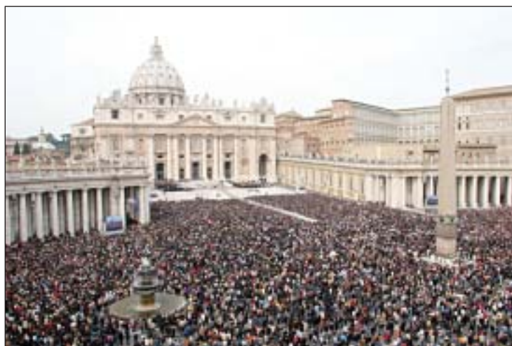
Za agitpropovce Vatikan je bio utjelovljenje svega zla

Teorijsko-praktični odnos komunista prema religioznosti temeljen je na teorijama klasika marksizma, lenjinizma, ne smije se izostaviti ni staljinizam, što se ukratko može sažeti u tezu da je vjera kočnica razvitku pojedinca i društva, te da je nužno oslobađanje cjelokupne stvarnosti od religioznog otuđenja (koje je s filozofskim otuđenjem bilo svrstano u »ideološka otuđenja«), i to svim sredstvima.