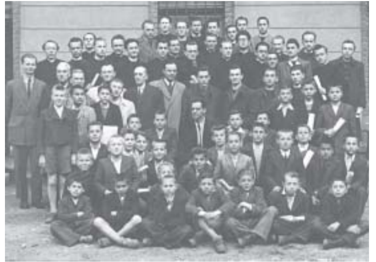
● Agitprop je vodio i pedantne popise o svim bogoslovima i sjemeništarima

Broj nastavnika koji polazi crkvu sve se više smanjuje, a naročito poslije V. kongresa KPI, jer se ovo pitanje zaoštava u nastavničkim