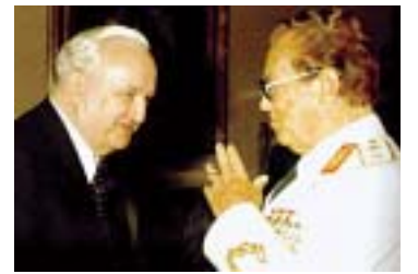
● Vladimir Bakarić (u razgovoru s Titom) odlučivao je i o predsjedniku ondašnje JAZU