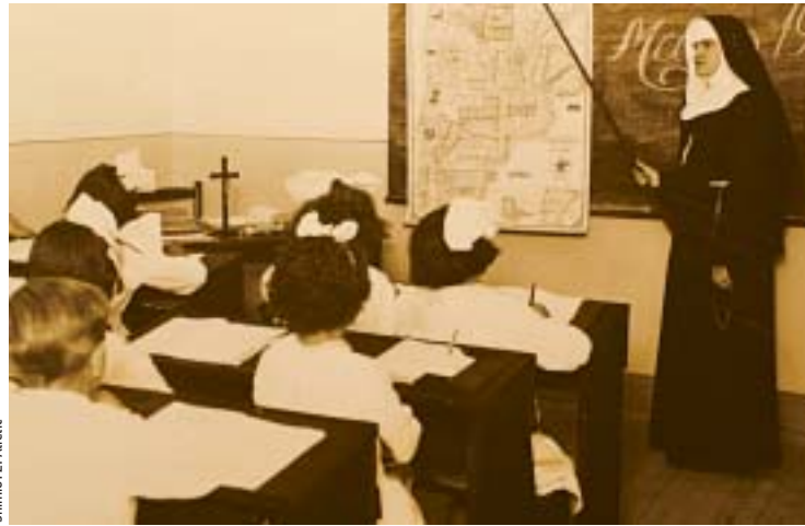
● Agitpropovci su vjeronaučnu nastavu u školi eutanazirali planski i sustavno

mjeseci donio je vijest da su u našim brodogradilištima popravljene sve ratne lađe« (kut. br. 5, str. 7).