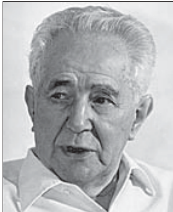
Smjernice Agitpropovu radu davao je i jedan od ključnih Titovih suradnika – Milovan Đilas

Vodeću ulogu u iskorjenjivanju vjeronauka nakon Drugoga svjetskog rata u Hrvatskoj imao je komunistički Agitprop. Na kojim se ideološkim odrednicama temeljila njegova djelatnost, kakvim se metodama služio, koji su bili njegovi najistaknutiji članovi i dr. pokazuju izvorni Agitpropovi dokumenti, koje donosimo u ovome feljtonu