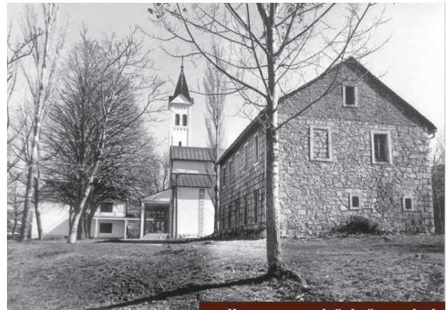
Kongora, negdašnja župna kuća

Po svom dolasku u Kongoru fra Stjepan se najprije zauzeo za Društvo sv. Ante. Sačuvano je jedno njegovo pismo »dragom kolegi« u Mostar, pisano 24. svibnja 1938., u kojem piše da mu šalje 120 dinara za zastavu Društva, za mušku mladež. Misli da će, kad vide tu zastavu, naručiti još koju. U Kongori, nastavlja, nema ništa nova, kiša stalno pada. Sljedeće godine na dnevni red dolazi neplaćeno zvono. Zvono je 1930. izlio u Zagrebu Kvirin Lebiš, poznati ljevač zvona. Bilo je teško 300 kg, s jarmom 328 kg, a cijena mu je bila 12.750 dinara. Za prijevoz od Zagreba do Kongore plaćeno je dodatnih 2000