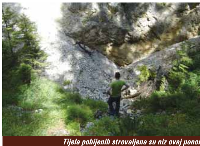
Tijela pobijenih strovaljena su niz ovaj ponor