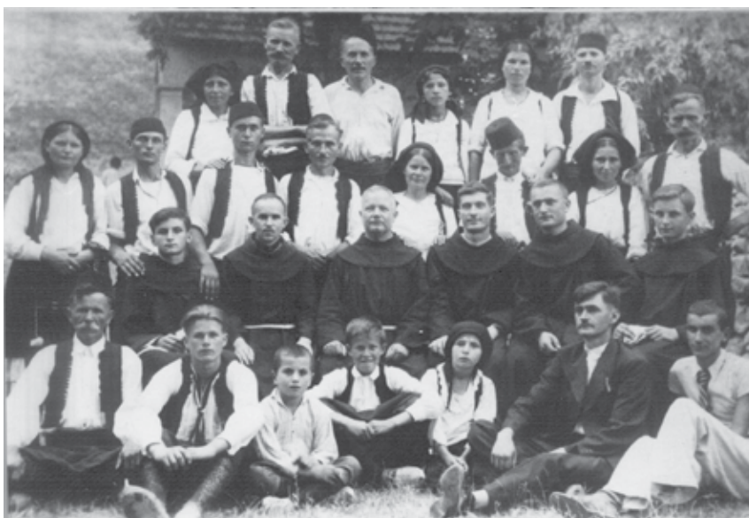
Na Humcu 1935. s novoobučenim novacima i njihovom rodbinom