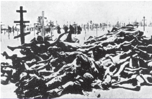
Gladomor u Ukrajini 1932./33., česta slika na grobljima

Marksova teorija da život, stvarnost, određuje svijest, i obrnuto, provođena je u komunizmu s dotada neviđenom dosljednošću. Život pojedinca učinjen je potpuno ovisnim o društvu. Pojedinac je izgubio svaku važnost i zato ga se može nesmetano uništiti ako to traži »više dobro«. Svijest pojedinca, prema komunističkoj utopiji, treba tako odgojiti da ona vidi i prihvaća stvarnost oko sebe samo na partijski propisan način.