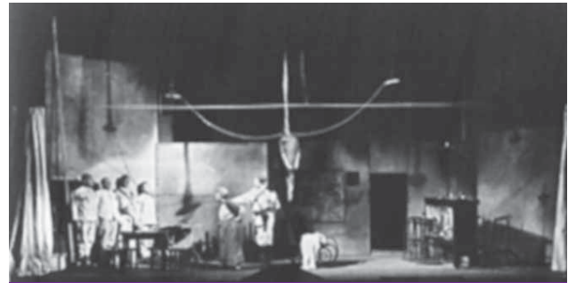
Jedno djelo uvjerenog komuniste Bertolda Brechta na pozornici

F. Furet pokušao je istražiti nastanak komunističkog terora i posebno se pozabavio određenim vre-