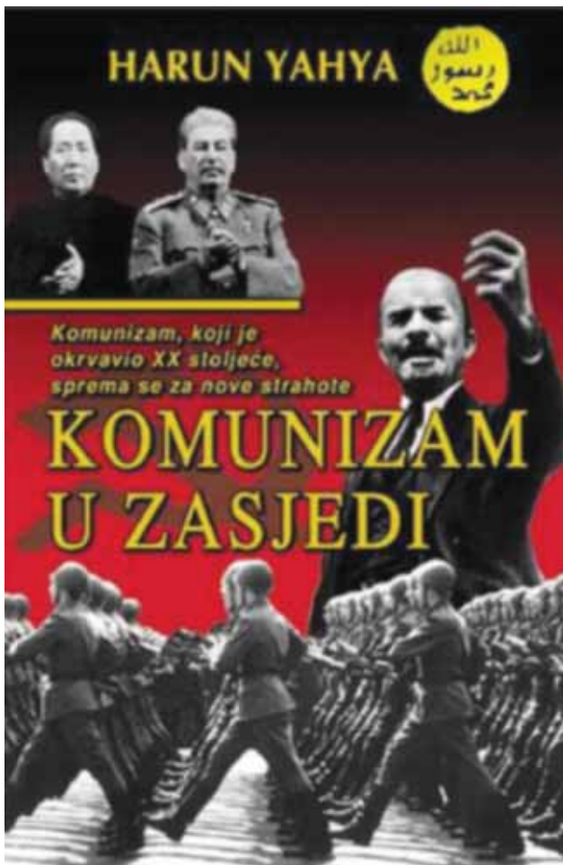
Jedna od naslovnica knjiga o zlima komunizma

Oktobarskom revolucijom 1917. komunistička ideja, dotada samo teorija, prvi put u povijesti dobiva mogućnost prikaza kakvo društvo želi izgraditi. Društvo koje komunisti žele izgraditi odgovarat će zahtjevima Marksova i Engelsova Manifesta . Oktobarska je revolucija za mnoge još i danas »mitski« nadnevak: kraj ugnjetavanja i izrabljivanja radničke klase, proletera, početak novog, boljeg svijeta. Ovdje ne želim prikazati povijesni tijek Oktobarske revolucije nego pokazati događaje u kojima se vidi ostvarenje komunističke ideje. Mnoge brojke koje navodim u ovom poglavlju ne žele samo pokazati odnos kvalitete i kvantitete komunističke utopije, nego odgovaraju i formalno novoj komunističkoj stvarnosti. Karakteriziranje stvarnosti uz pomoć brojki, statistike, kako je to i kod G. Lauba prikazano, bio je omiljen način komunističkog ophođenja sa stvarnošću (koliko kilometara cesta, pruga, koliko kilograma pšenice, koliko pionira itd.). Egzaktnim brojkama pokazati stvarnosti komunističkog društva možda je najsnažnija kritika komunističke utopije.