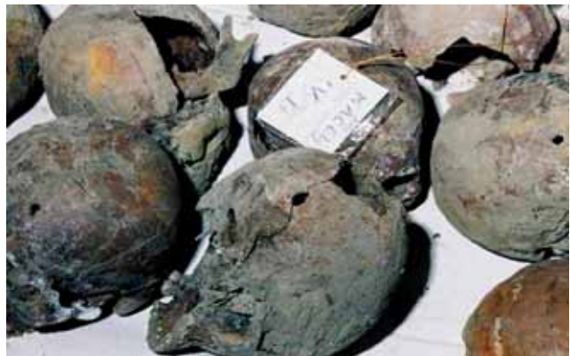
Macelj, prostrijeljene lubanje svećenika

Potpuno zajedništvo dobara služilo bi, po Platonovu mišljenju, potpunom predanju pojedinca u službi države. Posjed, žena, djeca samo odvrćaju od tog potpunog posvećenja državnoj službi. Ako se svatko brine samo o svom pojedinačnom dobru, onda nužno zaboravlja zajedničko dobro.