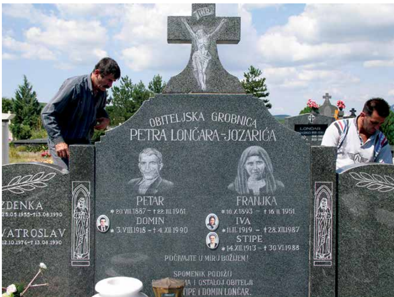
Vađenje uzoraka za DNK analizu iz obiteljske grobnice