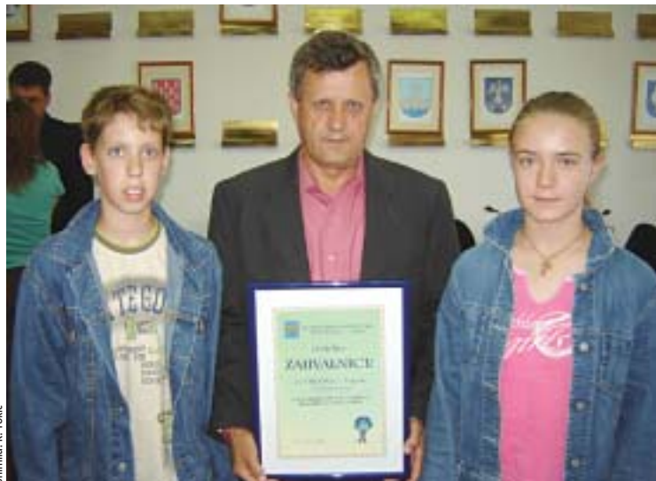
● Ravnatelj i učenici OŠ »Vrgorac« nagrađeni za iznimne rezultate u prikupljanju starog papira

— Na nadmetanju u prikupljanju starog papira 34 osnovne škole s područja splitsko-dalmatinske županije prikupile su čak 176 tona starog papira, spasio tako više od 3,5 tisuće stabala od sječe i uštedjevši 15 milijuna litara vode. Tim povodom je u četvrtak 8. lipnja u Splitu ravnatelj i učenike škola s najboljim rezultatima primila zamjenica splitsko-dalmatinskog župana Anđelka Vuko dodijelivši im diplome i zahvalnice zbog nastojanja na očuvanju okoliša.