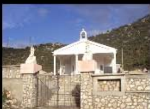
Grobljanska kapela - Neum