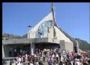
Crkva Gospe od Zdravlja Neum