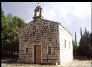
Crkva Svetog Ante - Neum