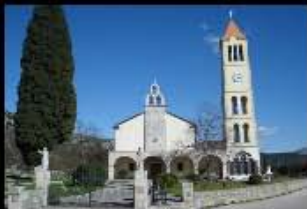
Crkva UBD Marije Gradac