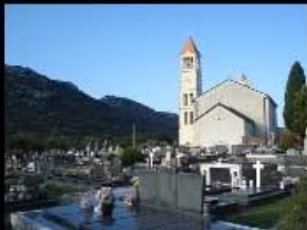
Gradačka Crkva pogled s groblja