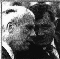
Tadić i Dodik