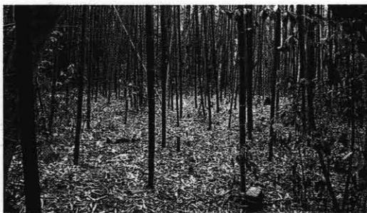
● Ostaci ljudskih kostiju među brijunskim bambusima

»Pobjegao sam dva dana prije Božića 1946. Htio sam otići u šumu, a mama mi je zrelije mislila, pa mi je rekla da idem k starijem bratu u Slavoniju. Ona mi je savjetovala da odem k bratu i da se odmah uputim, samo da sačuvam glas. Našli smo se brat i ja u Zagrebu. Rekao sam mu da bježim, a on mi je kazao da odem, ali ne u njegov stan nego k susjedu u