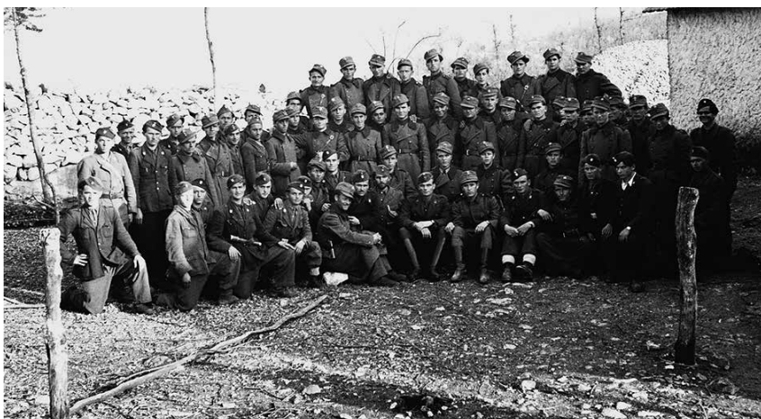
Jedna od hrvatskih postrojbi koja je branila Široki Brijeg

»Mi smo bili na našem kamionu "Bianca" koji smo uzeli u Omišu. Na njemu su bile tri bačve benzina i drugi ratni materijal. Najedanput je neka panika bila, Bog zna ili zlonamjerna ili obratno... došla je zapovjed