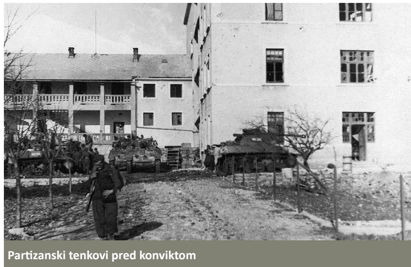
Partizanski tenkovi pred konviktom