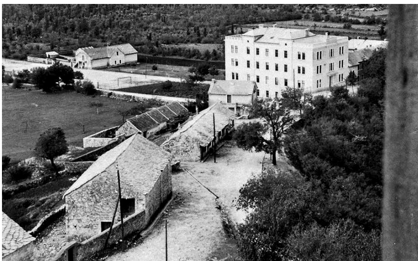
Ovo su negdašnji franjevački dućani na dijelu ceste između konvikta i crkve. Komunisti su ih dokinuli nakon svoga prolaska.

o povlačenju. A kuda? Doli niz grabe na Širokom Brigu... doli prema rijeci Lištici, di gimnazija i samostan imaju električnu centralu«, tvrdi Stanko te dodaje da je, nakon povlačenja, »kamion ostao pod jednim drvetom nekoliko desetaka metara zapadno od protuzrakoplovnog skloništa...« 14