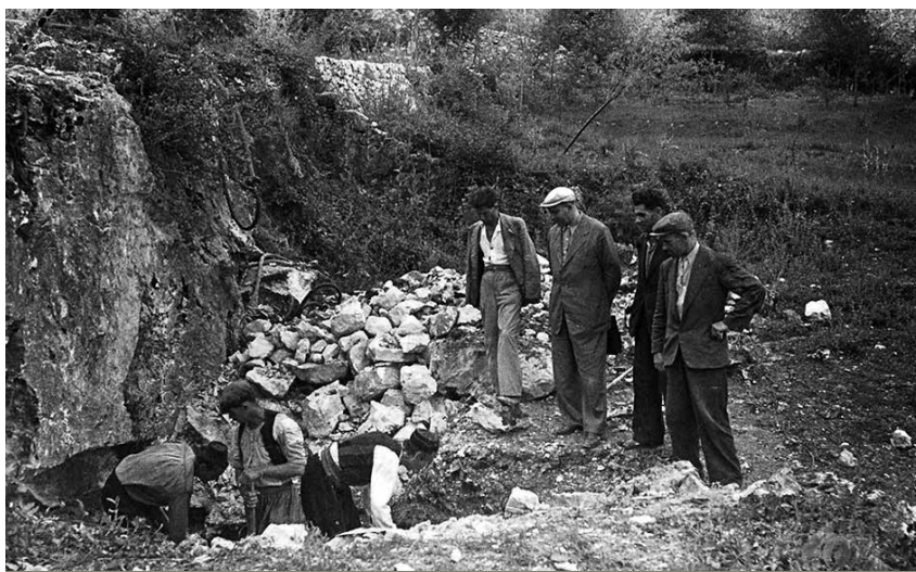
Gradnja protuzrakoplovnog skloništa po odredbi državnih vlasti

Značajka dijaloga vođenog toga dana između partizanskih oficira i fratara u zbornici ogleдалa se u »neprekidnim ulaženjima i izlaženjima oficira«, tvrdi nekoliko očevidaca tih događaja u svojim iskazima objavljenim u knjizi Istina o ubijenoj gimna-