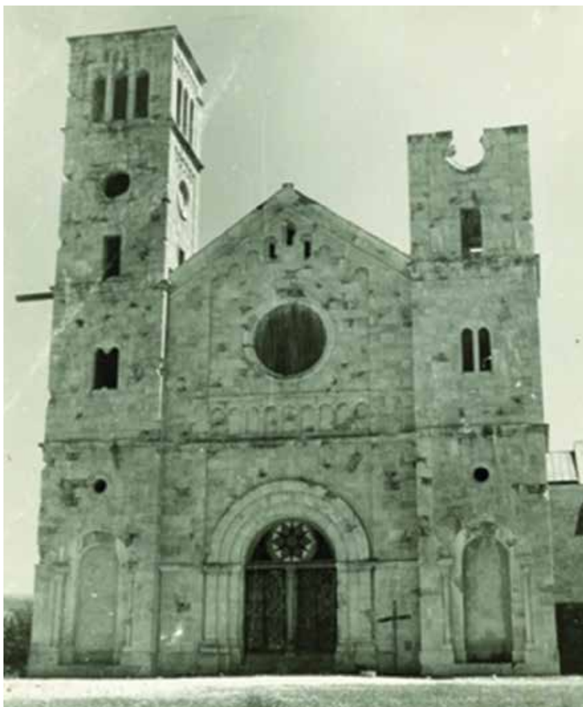
Samostanska je crkva pogođena 296 puta i teško oštećena

»Dolazeći u samo mjesto Široki Brijeg prošli smo pored crkve, te Franjevačkog samostana i Širokobriješke gimnazije. Od ljudi gotovo nikoga nismo vidjeli ni sreli. Na prolazu pored crkve, nakratko, zastali smo i razgledali okolinu... Topovske i minobacačke granate, te avionske bombe, prekopale su i razorile kako zemljište tako i građevinske objekte. Izgorjela je zgrada gimnazije«, 17 tvrdi Galić ostavljajući čitatelja pod dojmom da je riječ o tragovima preostalima nakon bitke, a ne bestijalnim i unaprijed planiranim topničkim udarima na crkvu i franjevački samostan. Međutim, odmah zatim Galić se odaje i tvrdi da, ipak, nije riječ isključivo o tragovima običnog boja dviju suprotstavljenih vojski. Iznoseći svoja zapažanja, Galić neizravno potvrđuje da je, prema onome što je vidio, riječ o planiranom zločinu s pljačkom kao jednim od temeljnih ciljeva.