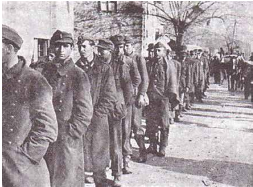
Uhićeni hrvatski i njemački vojnici u bitci za Široki Brijeg

Sumirajući odgovornost postrojbi i zapovjednika, nameću se dvije mogućnosti. Prva je ona o egzekutorima iz sastava VIII. dalmatinskog korpu-