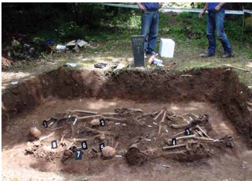
Prva masovna grobnica s osam tijela