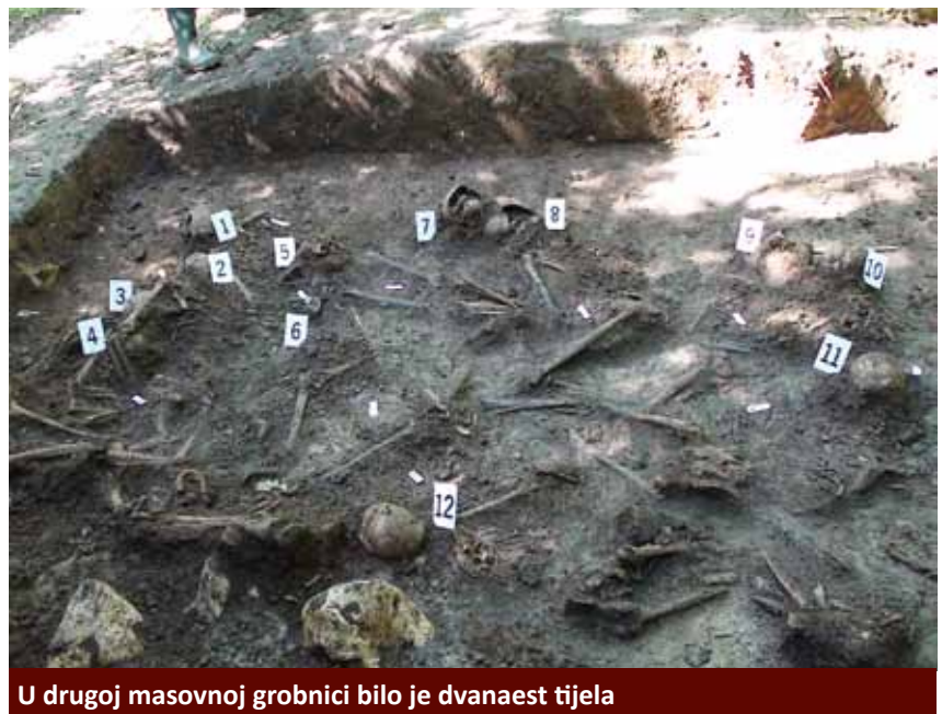
U drugoj masovnoj grobnici bilo je dvanaest tijela

Pronalazimo i nekoliko ostataka čizama. Najvjerojatnije je riječ o vojnicima, međutim još je to teško reći jer kosti otkopavamo samo do određene razine potrebne za rad forenzičara. Tu su i ostatci telefonske žice koja se pojavljivala i u Zagvozdu i u Vrgorcu. Očito je ista postrojba, XI. dalmatinska brigada, bila na djelu ili je to bio način ubijanja čitavog Osmog korpusa. Zastrašujuće djeluje i ostatak oboda kape