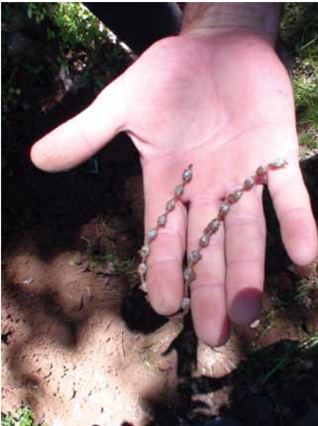
Ostatci pronađene krunice

najzahtjevniji dio posla: razdvajanje posmrtnih ostataka tijela i smještanje u posebne kutije zbog naknadne identifikacije. Znamo da to ne će biti lako. Sve je ispremiješano.