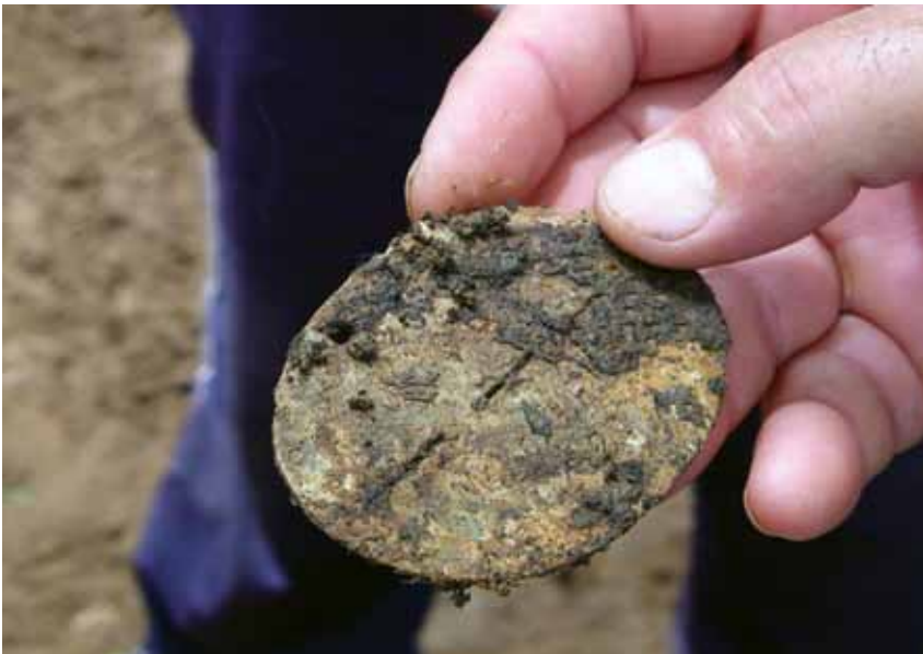
Vojnička identifikacijska pločica tek izvađena iz zemlje

i poraća na području općine Široki Brijeg dovršilo i njemačkom veleposlanstvu poslalo dopis o pronađenim njemačkim vojnicima. Poznaajući ih, vjerujemo da će se dostojno pobrinuti za svoje.