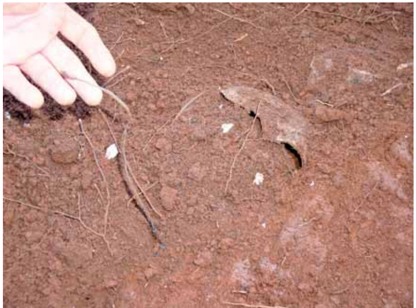
Žica i kosti provirili su iz zemlje