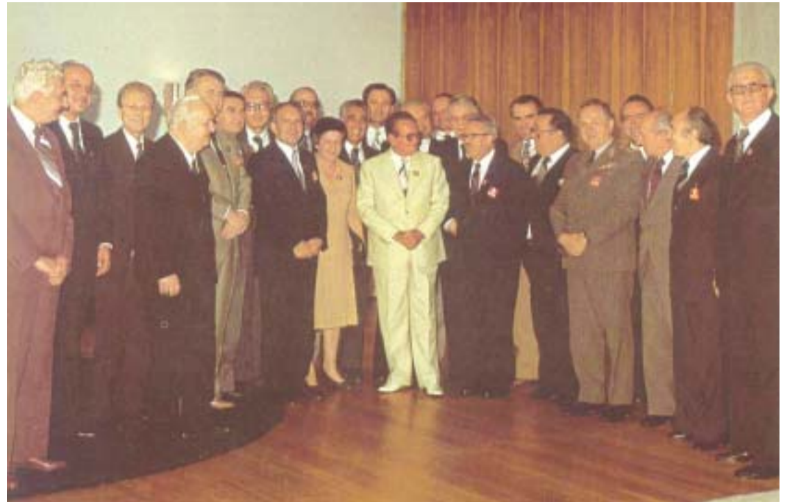
● Josip Broz tzv. Tito sa suradnicima - sljedbenici totalitarne ideologije i tvorcii represivnog državnog sustava

druću neprijateljske djelatnosti vjerskih zajednica«. U međuvremenu je kao viši inspektor iz Republičkog SUP-a Hrvatske g. 1988. prešao u SSUP - SDS, odakle pred raspad Jugoslavije g. 1991. odlazi u mirovinu. Za vrijeme Domovinskog rata živio je u Osijeku, a od g. 1988. u Bilju u Baranji. Umro je g. 2005.