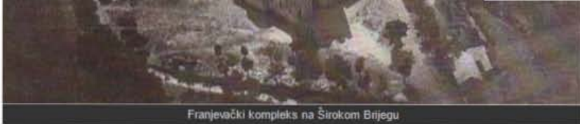
Franjevački kompleks na Širokom Brijegu

Nejasno je, međutim, iz kojih je razloga većina iskaza Ergičevih i Vuletićevih „drugarica“ objavljen u ovoj knjizi fokusiran upravo na samostan na Širokom Brijegu.