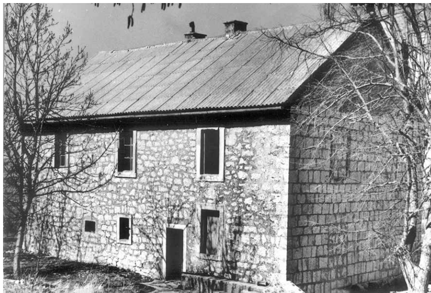
Nekadašnja župna kuća u Kongori

Kakova je kuća, župni stan? Vrata vanjska od kuhinje su razbijena, petora vrata u kući od soba razbijena, gdje su ljudi spavali. U kući nema ništa. Ne znam, da li je fra