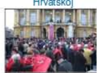
Povodom druge obljetnice Rezolucije Vijeca Europe