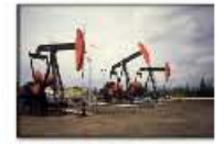
Karlovice Svjetske rezerve na