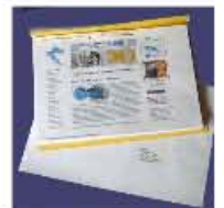
Potpura B. Glavaš OSJEK-NEBESKARMI