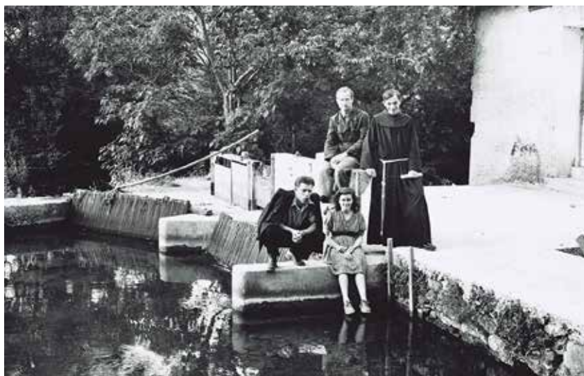
Idila na franjevačkoj mlinici i hidrocentrali prije dolaska komunista. Nakon toga pronađeni su franjevci pobijeni te je nastupilo oduzimanje i rušenje mukom građenih zgrada

Budući da se ranije vjerovalo da skupinu pobijenih ljubuških franjevaca treba tražiti u masovnim grobnicama u blizini tog mjesta, a skupinu franjevaca odvedenih iz franjevačke hidrocentrale i mlinice na Širokom Brijegu negdje »na putu prema Splitu«, nova je spoznaja, sama po sebi, nametnula pitanje o okolnostima,