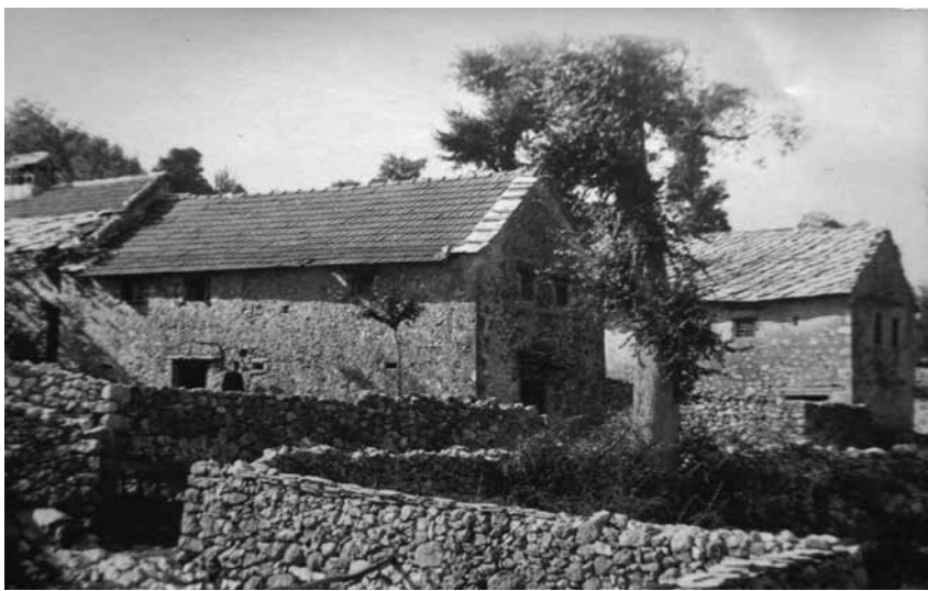
Kuća na Čerigaju prije obnove u kojoj su se fratri nastanili nakon dolaska u Hercegovinu

Pa tko su zapravo i što su bili ti ozloglašeni hercegovački franjevci uopće, a širokobriješki franjevci na-