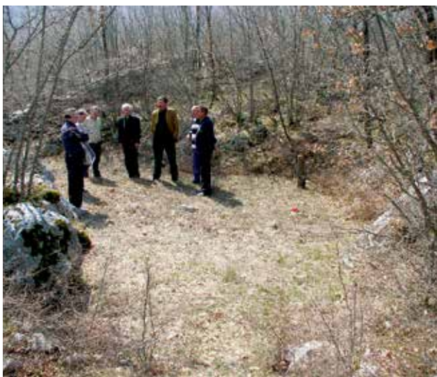
Masovna grobnica u Zagvozdu prije početka otkopavanja

U dogovoru s provincijalom fra Slavkom Soldom napravljeni su dopisi župniku don Jakovu Cikojeviću i načelniku općine Zagvozdo gospodinu Boženku Dediću. Oba su na dopise odgovorili pozitivno, te se moglo pristupiti ekshumaciji.