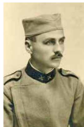
U starojugoslavenskoj vojsci