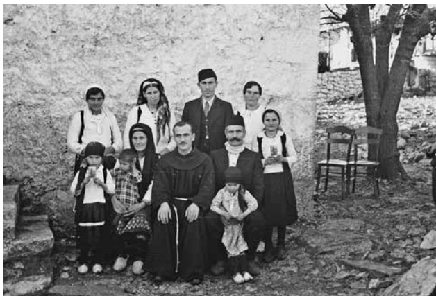
U prigodi mlade mise s obitelji