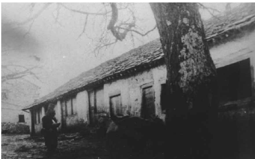
Negdašnji franjevački dućani na kojima su sada podignute privatne kuće