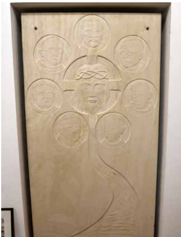
Skulptura »Vrata« postavljena kao spomen na pobijene franjevce u negdašnjoj samostanskoj zbornici, a sadašnjoj Franjevačkoj knjižnici