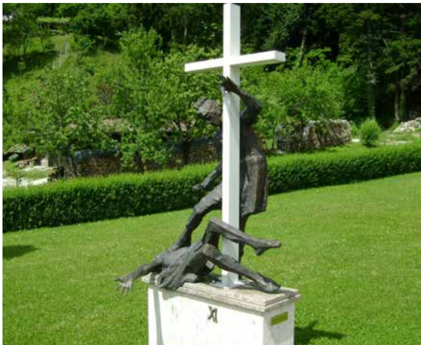
XI. postaja puta križa, dar Hercegovačke franjevačke provincije, pred crkvom Muke Isusove u D. Maclju, gdje je pokopan 21 svećenik i redovnik iz više zajednica, ubijeni na Križnom putu