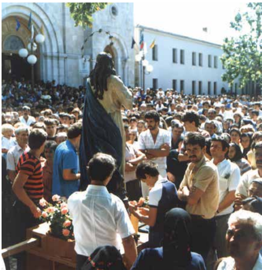
Proslava velike Gospe na Širokom Brijegu 1983.